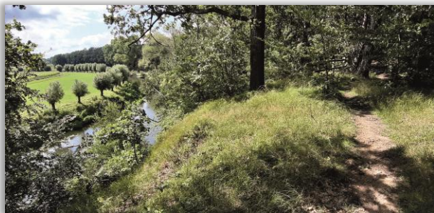
An der Stever