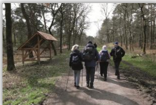
Auf der Ahsener Allee