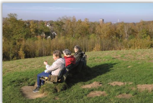
Auf der Halde Schwerin

Anmeldung bis 29.03. 20:00 Uhr bei Reinhard Klemp, Tel.: 02361 / 9434496