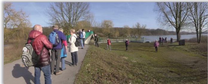
Brücke über den Hullerner Stausee

Sonntag 09:45 Uhr - FW R/E - 4 Std. - 12 km - RW 26.01. Rund um den Hullerner Stausee TP: Hbf. Vorhalle; VM: RE42, B272; VRR (B) Abf. 10:09 Uhr zur HSt. Haus Niemen Ank. 10:41 Uhr Wf. Ulrike Wegener , Tel.: 02361 / 6585288 Anmeldung bis 25.01. 20:00 Uhr