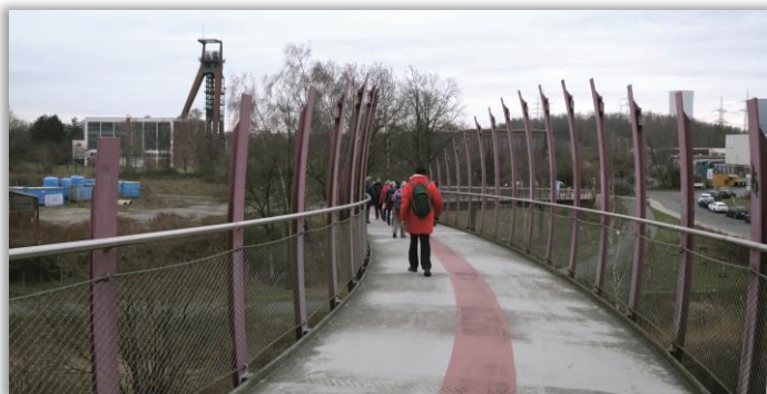
Blick von der Drachenbrücke auf die ehem. Zeche RE II