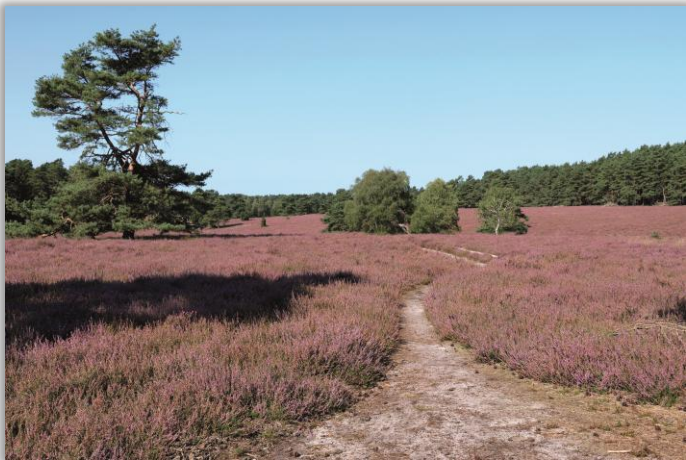
Heideblüte in der Misselhorner Heide