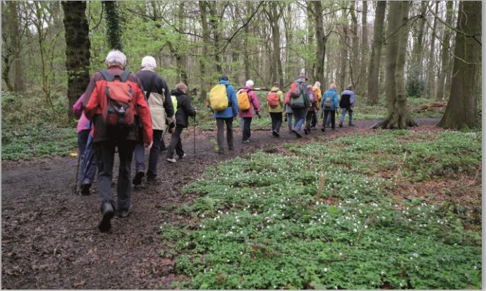
Buschwindröschen im Kölnischen Wald

Sonntag 08:50 Uhr - FW R/E - 4 Std. - 11 km - RW 13.04. Für Wallfahrer und Waldläufer