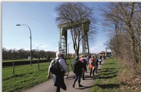
Wesel-Datteln-Kanal An der Flaesheimer Schleuse

Sonntag 09:50 Uhr - FW R/E - 4 Std. - 12 km - RW 02.02. Rund um Flaesheim TP: Hbf. Vorhalle; VM: RE2, B288; VRR (B) Abf. 10:04 Uhr zur HSt. Stiftsplatz Ank. 10:41 Uhr Wf. Kornelia Prescher , Tel.: 02361 / 32201 Anmeldung bis 01.02. 20:00 Uhr