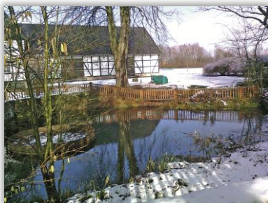
Quelltopf der Emscher

Sonntag, 26.10.2025 Umstellung auf Winterzeit