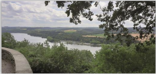
Blick von der Korte Klippe auf den Baldeneysee

Montag 10:00 Uhr - FW R/E - 4 Std. - 12 km - RW 09.06. Pfingstwanderung