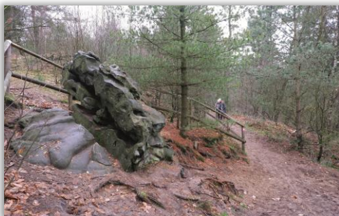
Überbleibsel vom Quarzit-Abbau Der Teufelsstein am Stimberg