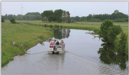
Floßfahrt in den Steverauen